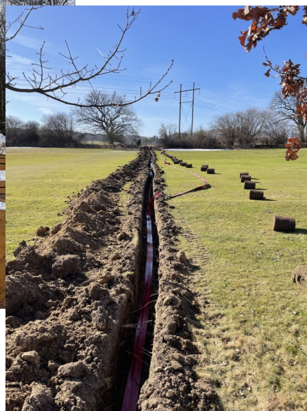
Strømkabler lægges i jorden