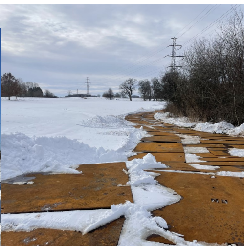
Jernplader til elkabler