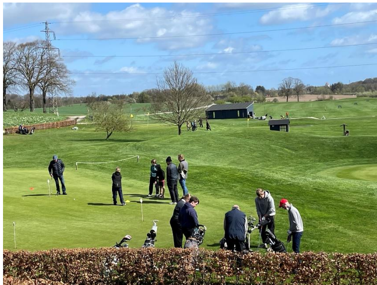
Foto: fra Golfens Dag 2024